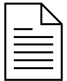
DESPACHOS DE ABOGADOS

Ofrecemos servicio a todos los sujetos obligados a cumplir con la normativa sobre Prevención de Blanqueo de Capitales y Financiación del Terrorismo y que, además, necesiten realizar nuevas operativas de negocio relacionadas con la gestión del riesgo derivado del momento actual (homologación de proveedores, etc.).