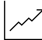
SGIIC, AGENCIAS DE VALORES Y EAFIS