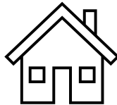
PROMOTORAS Y FI REAL ESTATE